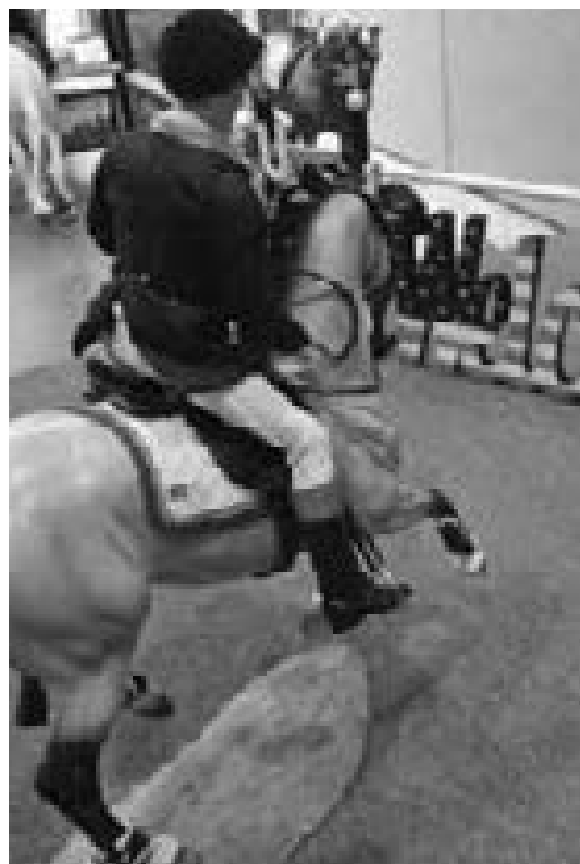
LS in Reken S. 41