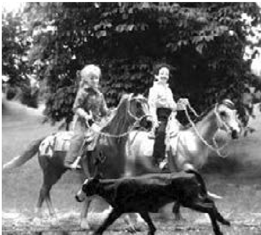
Neues vom Fleethof S. 10